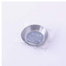
さじおき ツヤケン

no. : 411825 size : 62×59.5×13 mm price : 750 + tax