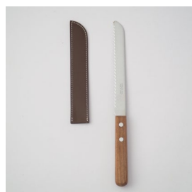
ブレッドナイフ & シース

また、アウトドアやピクニックなど外に持ち出す際に専用のレザーカバーがついていますので、安全に持ち運びできます。